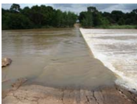
Over deze dam naar Botswana, 25 cm water

Wilt u meer weten, belt u voor meer informatie. 06-12048954. www.nijweidejachtreizen.nl