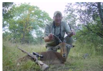
Impala 24 inch